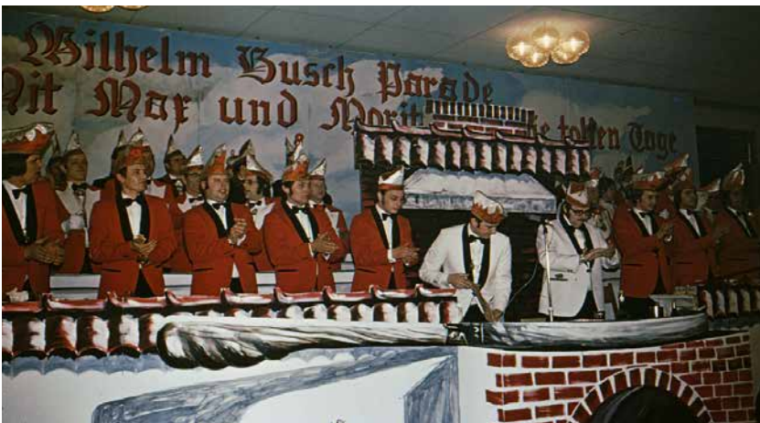
BWK Westfälische Fastnacht