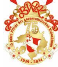
Sonderorden „75 Jahre BWK“ 22,00 EUR

Für die Verleihung von Verdienstorden nutzen Sie bitte ausschließlich das entsprechende Antragformular – Download auf bwk-online.de . Beachten Sie bitte, dass die Verleihung von Verdienstorden nur entsprechend der Kriterien der ‚BWK-Ehrungs-Ord-