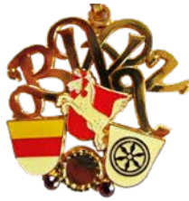
Verdienstorden „BWK- Verdienstorden in Gold“ 90,00 EUR (inkl. Urkunde)