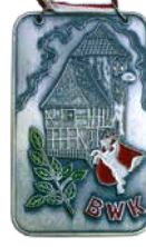
Sonderorden „Teufelsturm Menden“ 20,00 EUR